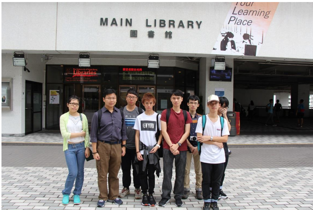
參觀後，同學們對港大圖書館加深了認識