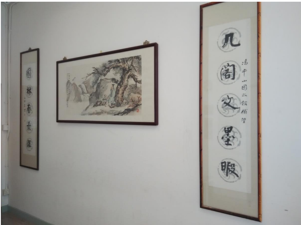
《詩中有畫，畫中有詩》，同學們應該感受到當中意境