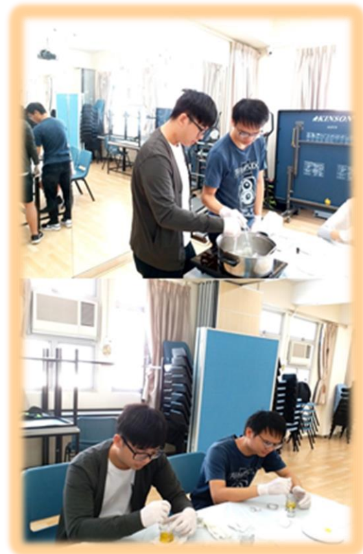
同學專心製作潤膚膏， 每個步驟都一絲不苟。