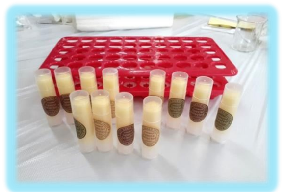
經過一番努力， 天然潤唇膏大功告成！