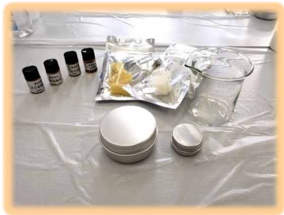
學生會幹事為同學 準備材料。