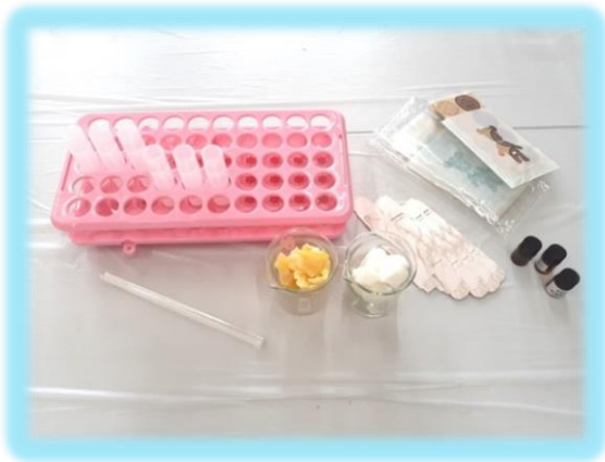
預備好潤唇膏原材料， 工作坊準備就緒。

他們運用原材料（蜂蠟、乳木果、維他命 E 及天然精油）製成潤唇膏，活動過程輕鬆，製作嚴謹，經過同學們一番心機，一支支天然潤唇膏便大功告成！