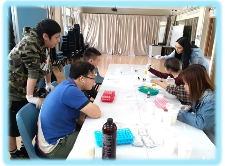
同學們專心聆聽如何製作潤唇膏。